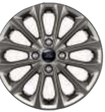
Jante aliaj 16" Rock Metallic (standard)

1 Asistența Ford pentru situații de urgență este o funcție SYNC inovatoare care folosește un telefon mobil cu Bluetooth® și conectat pentru a-i ajuta pe ocupanții vehiculului să inițieze un apel direct către centrul local de comunicații, după un accident care implică declanșarea unui airbag sau oprirea pompei de combustibil. Această funcție este operațională în peste 40 de țări și regiuni din Europa.