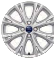
Jante aliaj 17" Silver (opțiune)