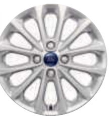
Jante de 16" din aliaj (opțiune)