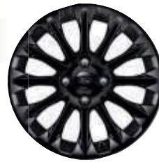
Jante aliaj 16" negre (standard)

Fiesta ST-Line Black (cu jante aliaj 17" negre (opțiune - disponibil in functie de tara)