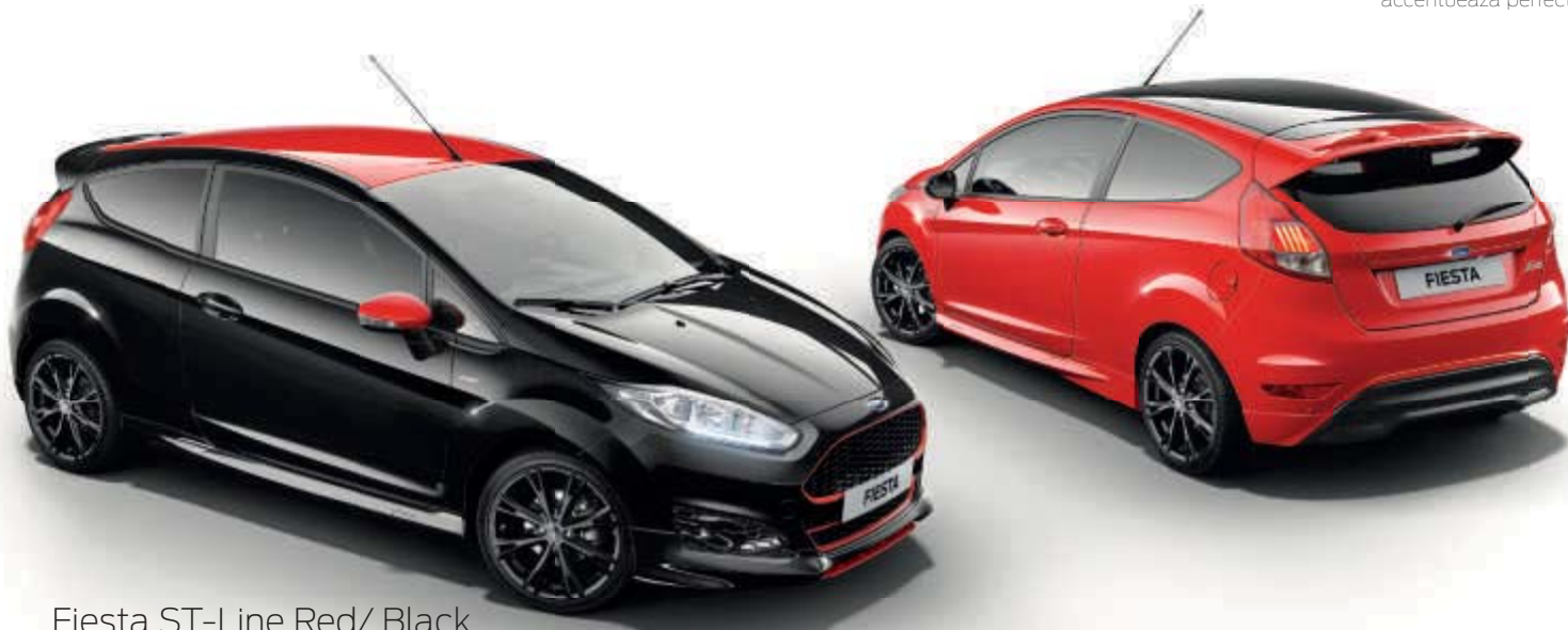
Fiesta ST-Line Red/ Black (disponibil in functie de tara)

Red & Black oferă experiența dinamică a conducerii Ford Fiesta ST-Line, împreună cu personalitatea suplimentară ce atrage privirile. Combinațiile unice de culori ale caroseriei, roșu Race sau negru Shadow cu acoperiș și carcase ale oglinzilor de culori contrastante, împreună cu setul complet de stil al caroseriei, accentuează perfect imaginea elegantă și sport.