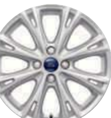
Jante aliaj 17" Sparkle Silver (opțiune)